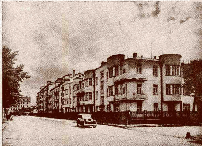
Nuevos edificios en Novinsky Street

En los alrededores de Moscou nos pasean por la muy reducida cantidad de calles del Nuevo Moscou, barrio dedicado a viviendas de obreros que, a pesar de su modernismo, no tienen nada de particular. Si se juzga por la fotografía parece que cada uno tiene por lo menos automóvil, pero ¡ay! el automóvil sólo está en las fotografías, al servicio de los extranjeros y de las camaradas dirigentes