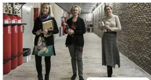
HERALDO.ES Las cuidadoras del tesoro literario del Paraninfo