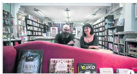
HERALDO.ES Cierra la librería Los Portadores de Sueños, tras 14 años en la vanguardia de la cultura