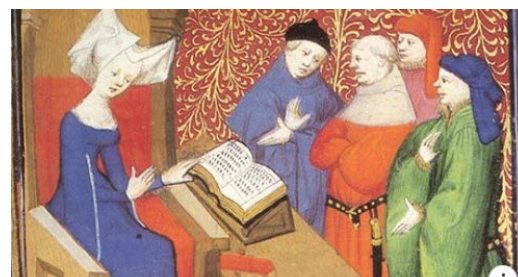
LAVANGUARDIA.COM Las mujeres también creaban manuscritos de lujo en la Edad Media