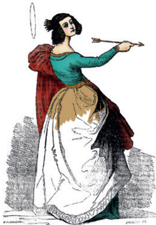
La Santa de la Flecha, por Barberán.

[Cuadro existente en el Museo Español de Paris.]