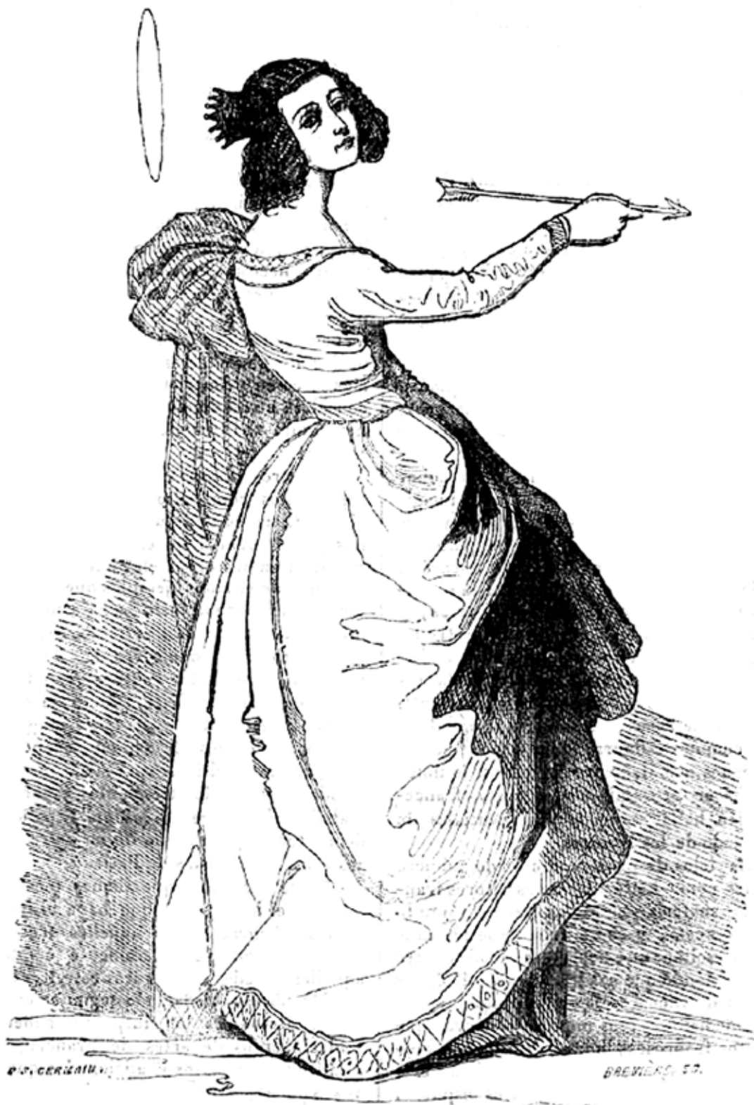
La Santa de la Flecha, por Zurbarán.

[Cuadro existente en el Museo Español de Paris.]