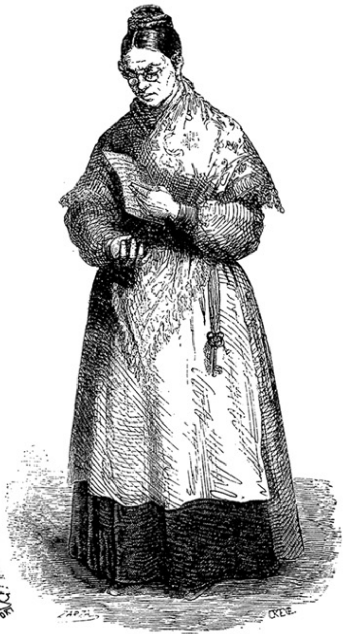
EL APRENDIZ DE LITERATO