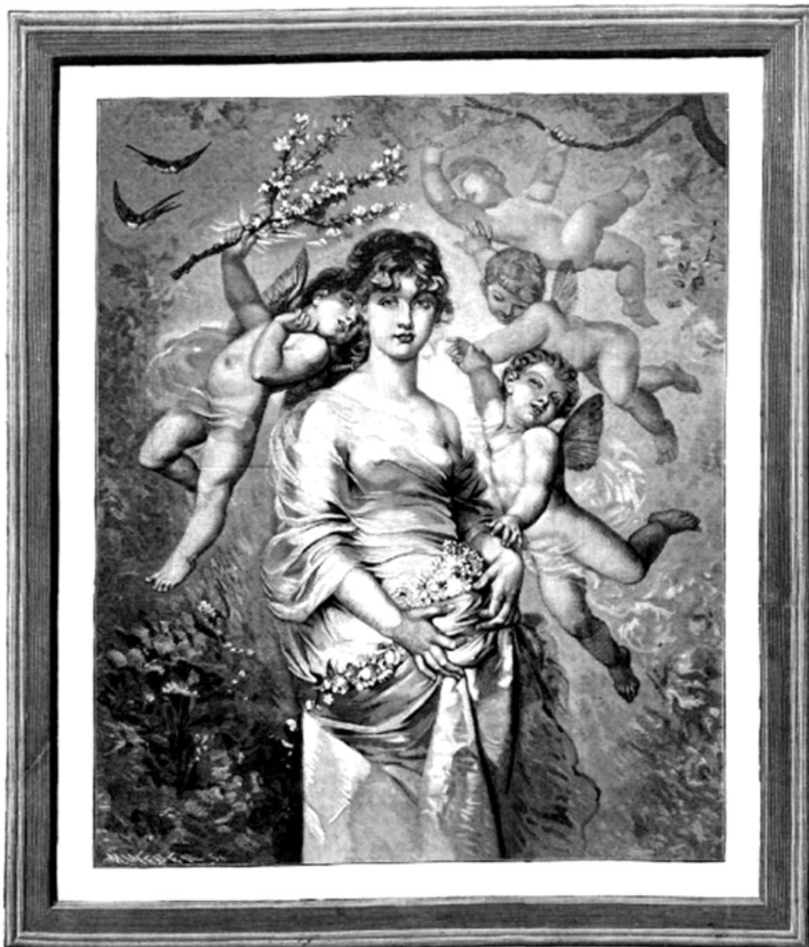
LA PRIMAVERA, copia de una fotografía de A. Bruun y C o de Paris

REGALO A LOS SEÑORES SUSCRITORES DE LA BIBLIOTECA UNIVERSAL ILUSTRADA