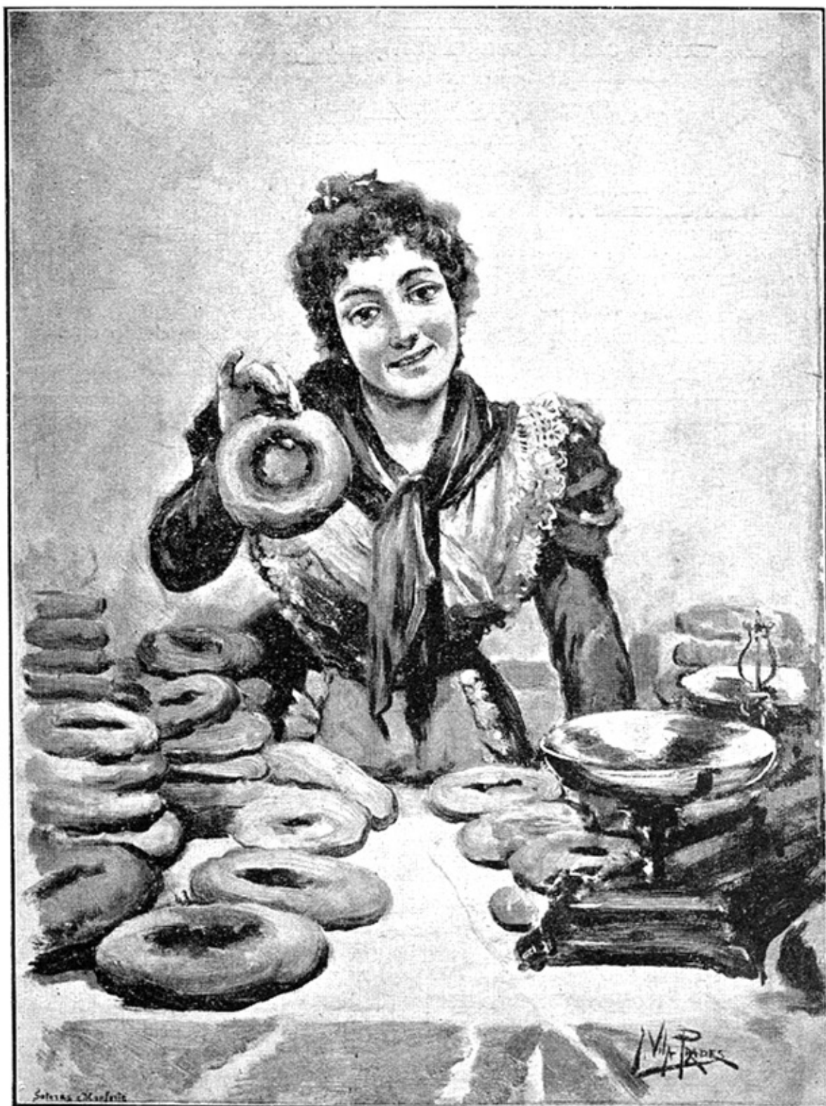
¿QUIERE V. UN ROSCON, SEÑORITO? (Cuadro de VILA PRADES)