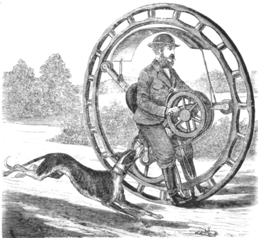
VELOCÍPEDO DE UNA RUEDA DE HEMMINGES

La Ilustración española y americana : Revista de bellas artes y actualidades. 10/2/1870.