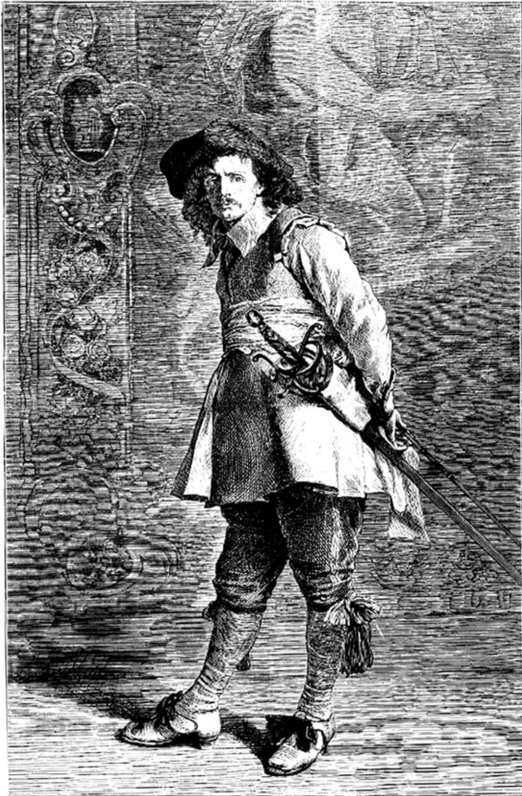
¿QUÉN VA ALLÍ? COPIA DE UN CUADRO DE REINSONNIER.

La Ilustración española y americana : Revista de bellas artes y actualidades. 30/5/1880.