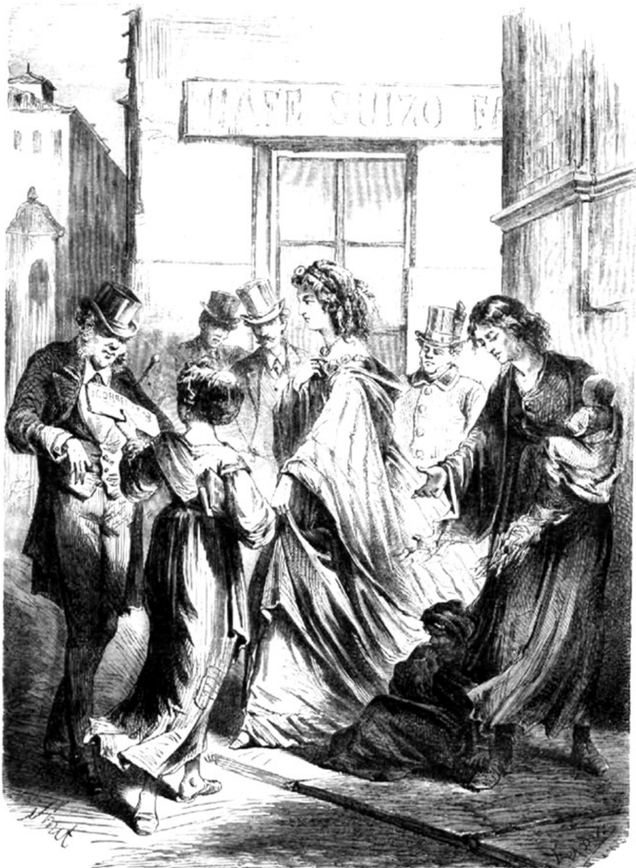
MADRID.— LA ESQUINA DE LA CALLE DE LOS PELIGROS.

La Ilustración española y americana : Revista de bellas artes y actualidades. 15/12/1870.