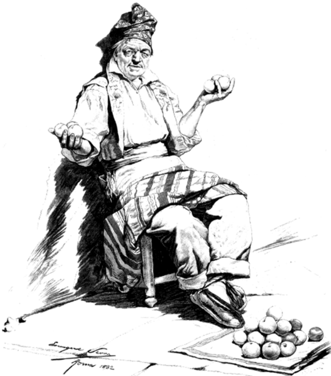
EL NARANJERO, dibujo de Enrique Serra

REGALO A LOS SEÑORES SUSCRITORES DE LA BIBLIOTECA UNIVERSAL ILUSTRADA