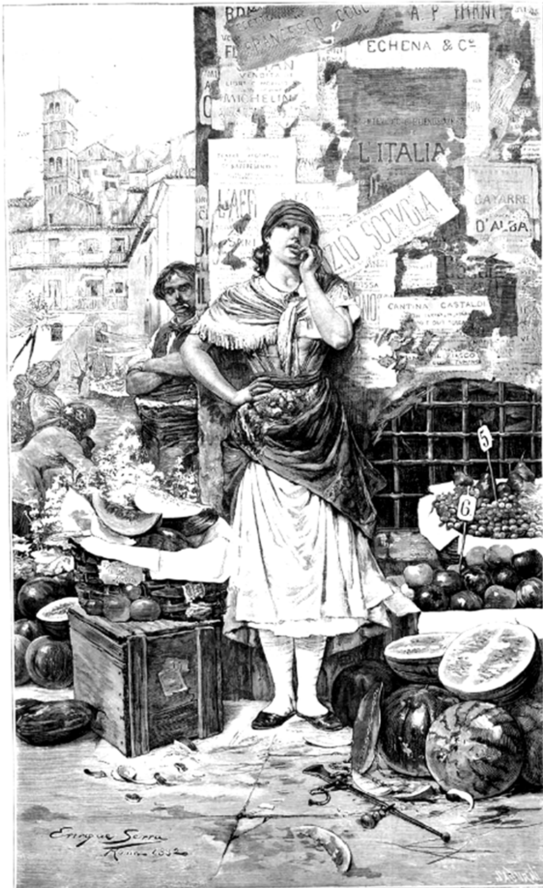
FRUTERA ROMANA, dibujo por Enrique Serra