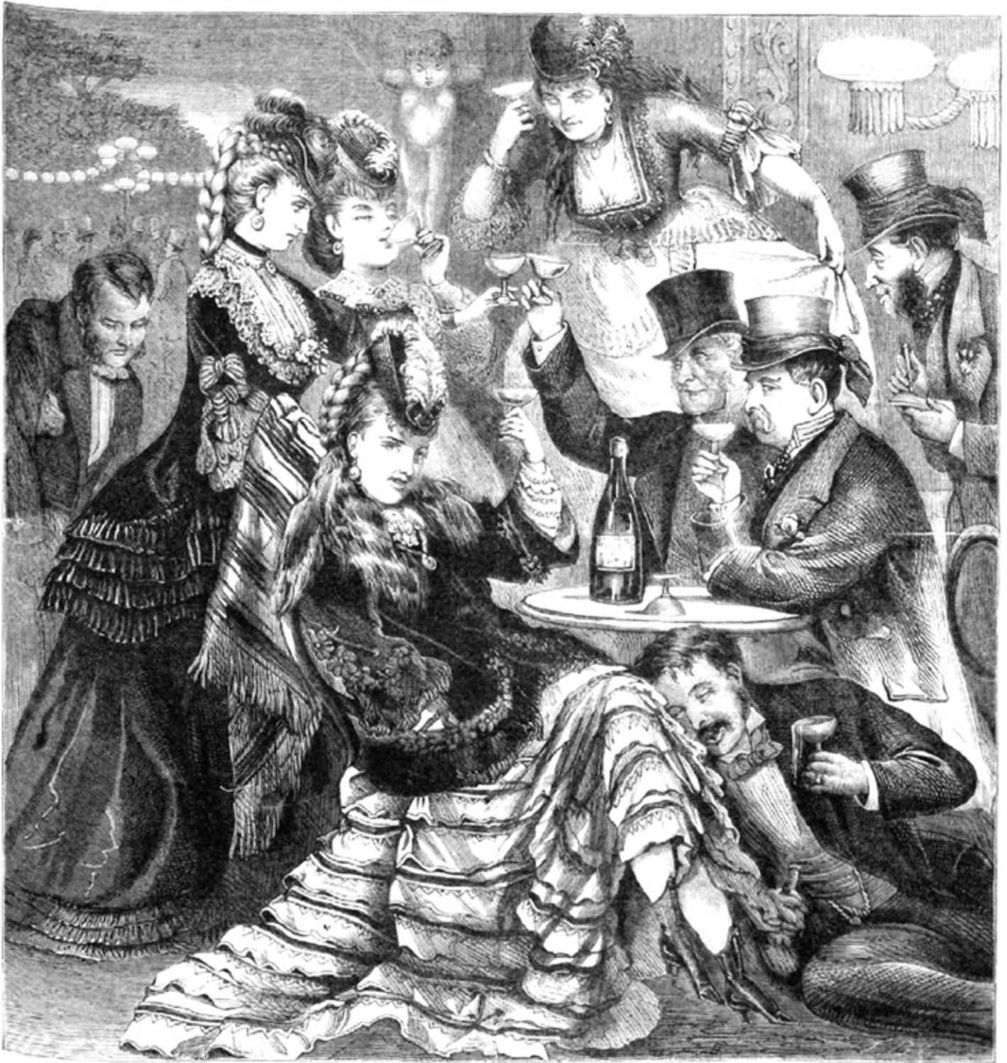
COSTUMBRES INGLESAS.—Los jardines de Cranborne, en las fiestas del Derby (pág. 331).

La Ilustración española y americana : Revista de bellas artes y actualidades. 1/6/1872.